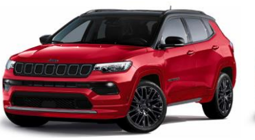
Model S: Colorado Red + Sort Tak