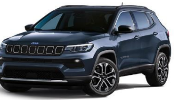
Limited: Blue Shade