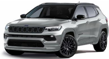
Model S: Glacier + Sort Tak