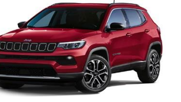
Limited: Colorado Red