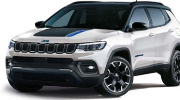
Trailhawk: Alpine White + Sort tak