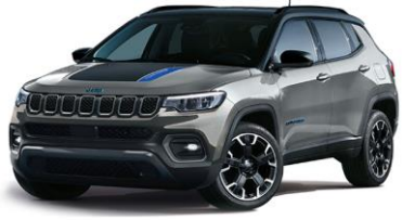
Trailhawk: Glacier + Sort Tak