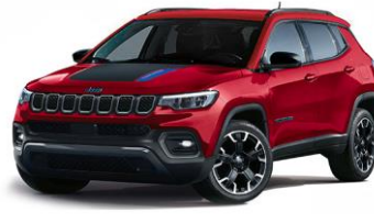
Trailhawk: Colorado Red