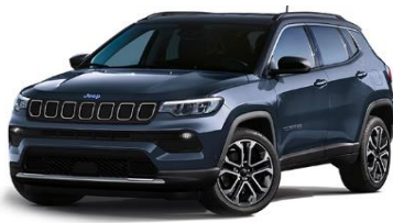
Limited: Blue Shade