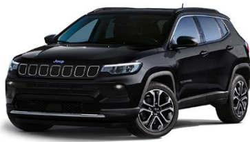
Limited: Solid Black