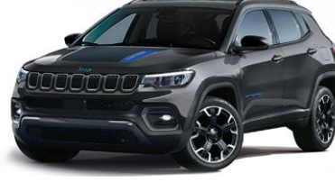
Trailhawk: Graphite Grey