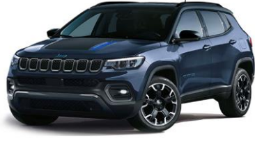
Trailhawk: Blue Shade + Sort tak