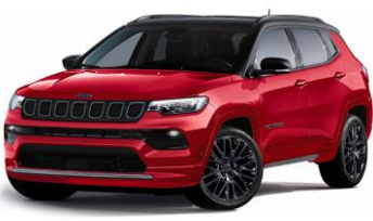
Model S: Colorado Red + Sort Tak