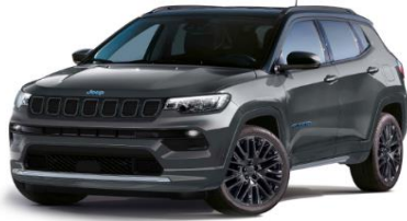
Model S: Graphite Grey