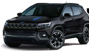
Trailhawk: Solid Black