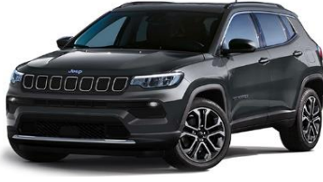
Limited: Graphite Grey