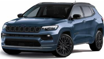
Model S: Blue Shade + Sort tak