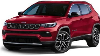
Limited: Colorado Red