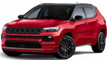
Model S: Colorado Red + Sort Tak