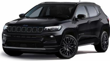
Model S: Solid Black