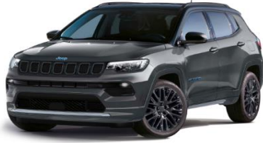
Model S: Graphite Grey