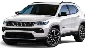
Limited: Alpine White