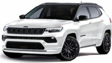
Model S: Alpine White + Sort tak