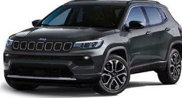
Limited: Graphite Grey