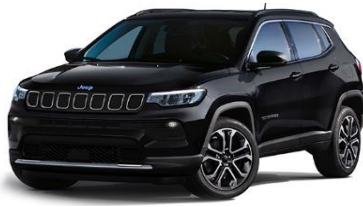
Limited: Solid Black