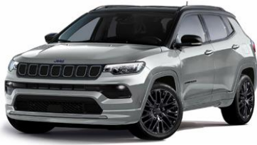
Model S: Glacier + Sort Tak