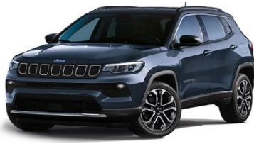
Limited: Blue Shade