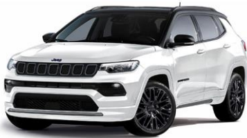
Model S: Alpine White + Sort tak