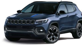
Trailhawk: Blue Shade + Sort tak