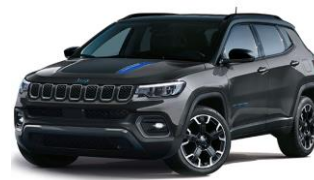
Trailhawk: Graphite Grey + Sort Tak