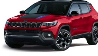
Trailhawk: Colorado Red + Sort Tak