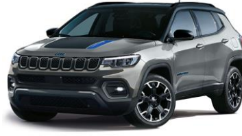
Trailhawk: Glacier + Sort Tak