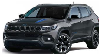
Trailhawk: Graphite Grey