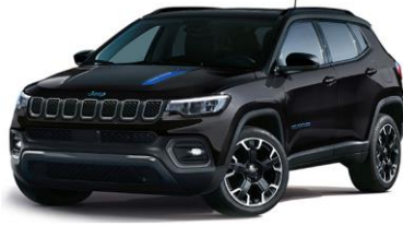
Trailhawk: Solid Black