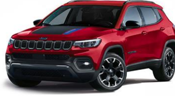
Trailhawk: Colorado Red