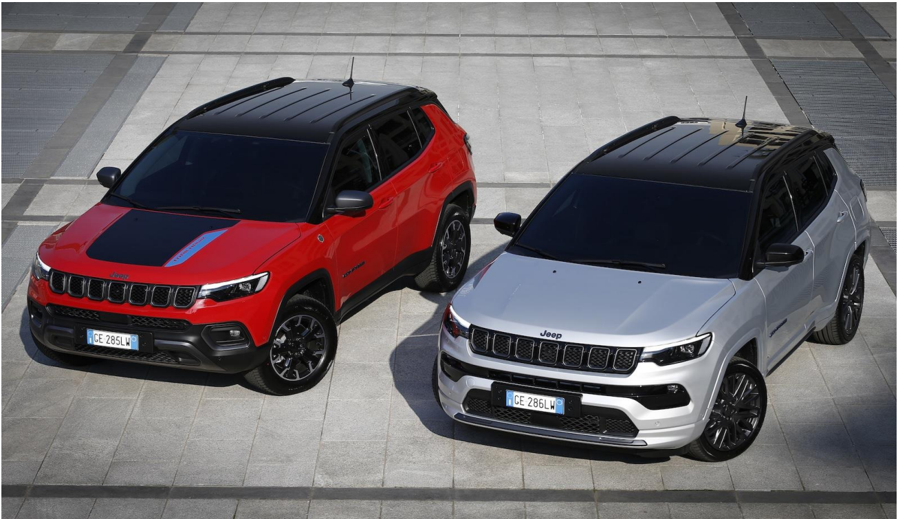
(Trailhawk til venstre og Model S til høyre på bildet)