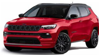
Model S: Colorado Red + Sort Tak