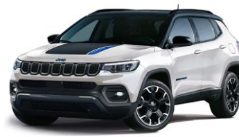
Trailhawk: Alpine White + Sort Tak