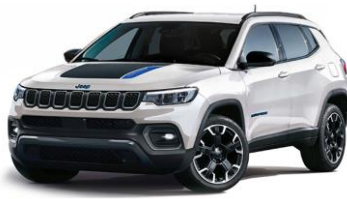
Trailhawk: Alpine White