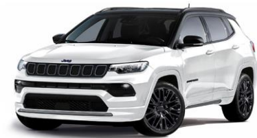
Model S: Alpine White + Sort tak