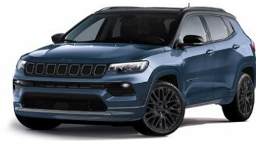
Model S: Blue Shade + Sort tak