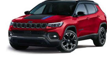
Trailhawk: Colorado Red + Sort Tak