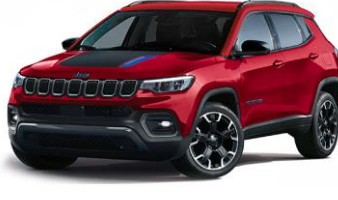
Trailhawk: Colorado Red