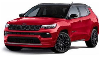
Model S: Colorado Red + Sort Tak