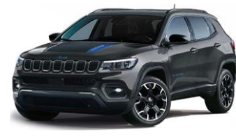
Trailhawk: Graphite Grey