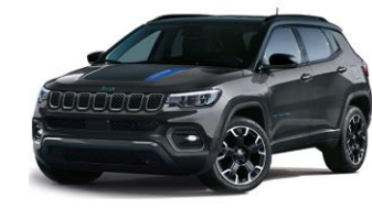
Trailhawk: Graphite Grey + Sort Tak